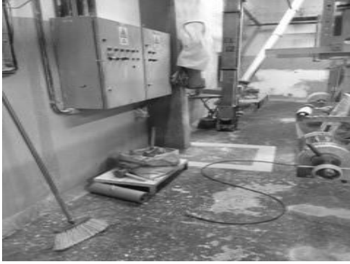
Figura 4 - Setor de empacotamento antes da limpeza