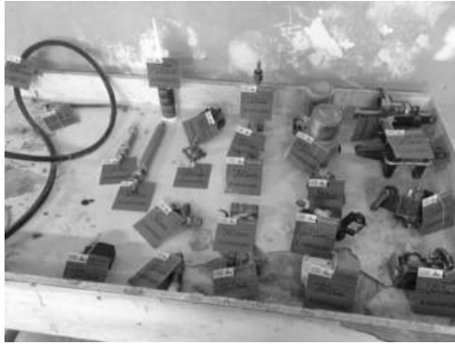
Figura 2– Peças e objetos retirados do setor de empacotamento para a área de descarte