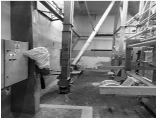
Figura 6 - Setor de empacotamento depois da limpeza