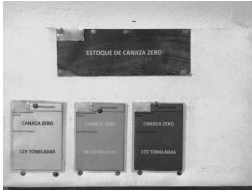
Figura 9 - Quadro de estoque de matéria prima situado no setor de empacotamento

como mostra a Figura 10, passando-se assim a informação para que a produção comece a fornecer matéria-prima para o setor.