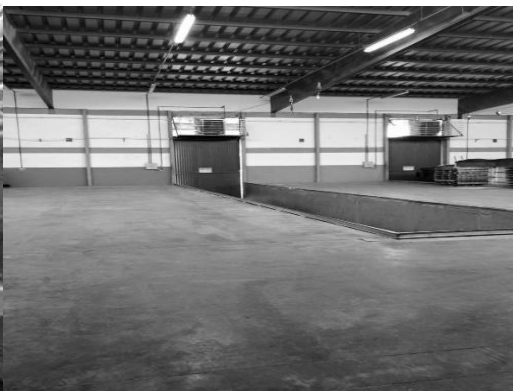
Figura 7 - Doca após o dia da limpeza

Integrou-se a ideia do cronograma especial de limpeza dos telhados e silos para a rotina do dia a dia, feito um quadro onde a supervisão juntamente com o planejamento determinam datas mensais de limpezas dos silos, de maneira a não atrapalhar a produção e o carregamento de produto final, visto que ambos dependem de armazenamento em silos. A Figura 6 mostra o quadro utilizado para registrar as datas das limpezas.