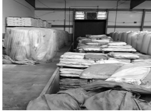
Figura 5 - Doca no setor de expedição com sacarias e produto final armazenados no local devido desorganização e sujeira onde deveriam estar alocados