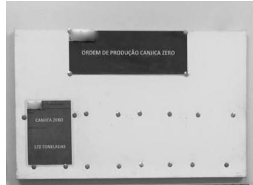
Figura 10 - Quadro de ordem de produção situado na sala de produção