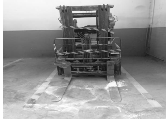
Figura 3 - empilhadeira sem uso no setor de expedição

A limpeza que costuma estar no S3, entrou como S2 nesta implantação dos 5S para facilitar a implantação dos S seguintes e observou-se a necessidade da planta em aumentar a eficiência na detecção de defeitos e fatores causadores dos mesmos, logo a limpeza é um fator determinante neste ponto.